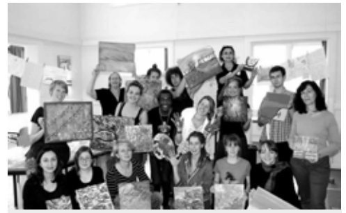
Trots op het eindresultaat

Immers, belangrijke competenties van kinderen komen door deze eenzijdige benadering – de meetbare kennis – niet uit de verf. Welnu, onze stichting heeft dit belangrijke en actuele onderwerp als leidraad genomen voor een 4 daagse internationale ontmoeting. We hebben studenten, ouders, leerkrachten, hulpverleners, pedagogisch medewerkers uit de kinderopvang en wetenschappers uitgenodigd vier dagen zelf actief te zijn op het gebied van spel, theater, muziek, muziektherapie, psychodrama, beeldende kunsten, ‘urban intervention’, etc. Deelnemers hadden de keus uit veertien workshops, die stuk voor stuk door specialisten verzorgd werden. Beide, workshops en presentaties, boden de deelnemers inspiratie en vaardigheden om in hun eigen werk toe te passen. Daarnaast boden wij ‘open podia’ aan waarin de deelnemers de kans konden grijpen iets over hun eigen activiteiten, initiatieven en plannen te vertellen.