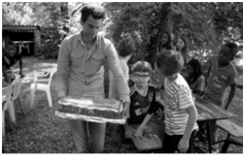
Het kamp bestaat 5 jaar, dus taart!