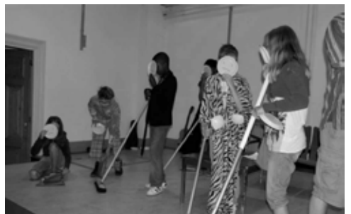
kinderen vinden improviseren geweldig leuk