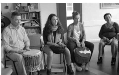
Kennismaking met muziektherapie voor kinderen

Alle dank gaat uit naar de conferentiewerkgroep die anderhalf jaar aan deze internationale ontmoeting heeft gewerkt. Maar ook alle lof voor de 14 workshop-