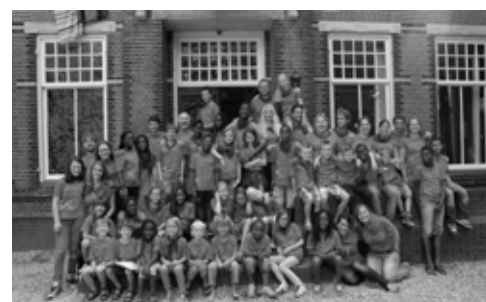
De hele groep

De vrijheid om jezelf te zijn houdt op waar die van een ander begint. Kinderen moeten ook naast elkaar en met elkaar zichzelf kunnen zijn, ieder op zijn eigen wijze. Maar wat is jezelf zijn eigenlijk precies? Als je boos,