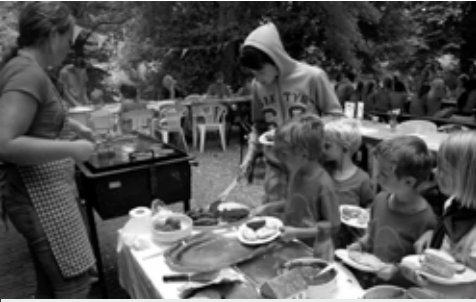
De laatste dag een lekkere barbeque

zonder het kind te willen sturen in een richting die voor ons gemakkelijker is. Zoals Korczak heeft gezegd: ‘Laten we niet de gezonde drang van zijn natuur kortwieken, alleen omdat het kind afwijkt van ons ideaal. Wij voeden het niet op ten behoeve van onszelf, maar om zijnentwille.’