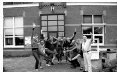
De Conferentie werkgroep