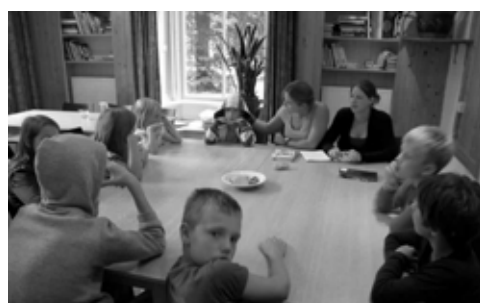
Elke dag kinderraad