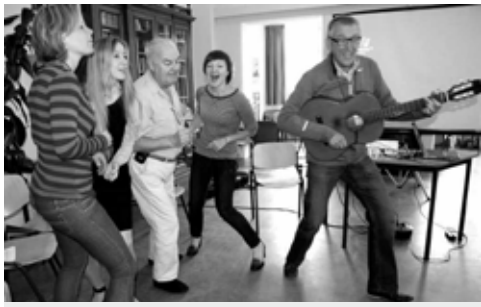
Zonder muziek kun je niet leven