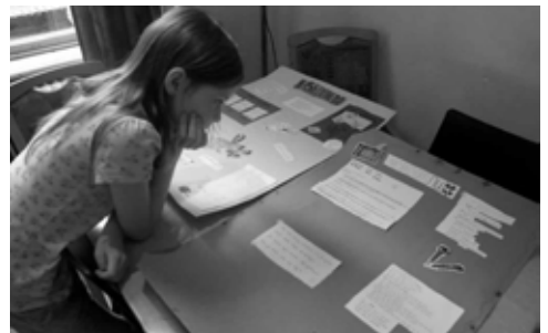
We maken onze eigen krant