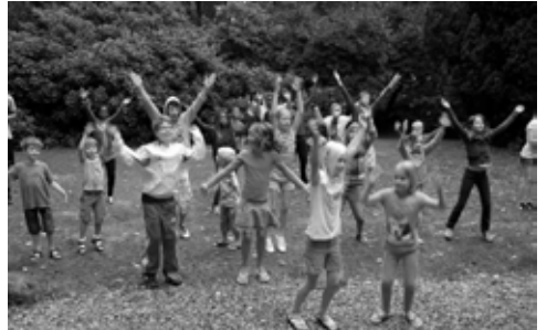
In elk kamp hoort ochtendgymnastiek