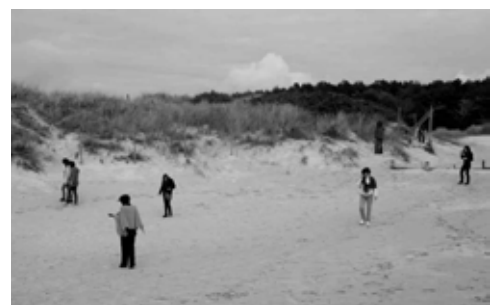
door de ogen van een kind: we zoeken spannende voorwerpen