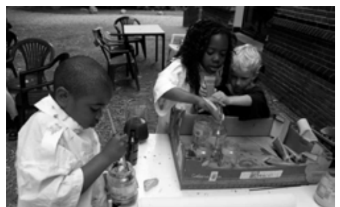
Elke dag leuke workshops