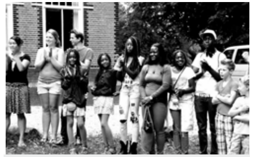
Eerst nog onwennig inde eerste kring

Uiteindelijk is elk kind bij ons gebleven, geen kind is weggestuurd. Of we daar goed aan hebben gedaan, is achteraf moeilijk te zeggen. Geen enkel kind heeft te horen gekregen: je moet hier weg, we willen je niet meer, we geven je op. Aan de andere kant zijn er misschien kinderen bij wie de scheldwoorden of bedreigingen nog door het hoofd spoken. We hebben geprobeerd hierin een balans te vinden, naar ons beste kunnen. Alle kinderen, zowel de zorgelijke als de zorgeloze, verdienen een mooi en veilig kamp. Het is onze taak om iedereen daarin de ruimte te geven,