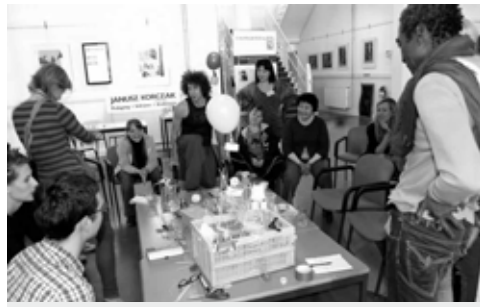
Een heerlijke ontdek-workshop