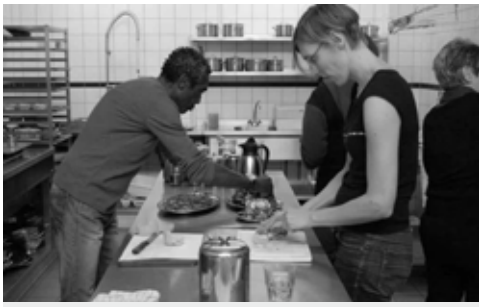
Deelnemers helpen een handje in de keuken