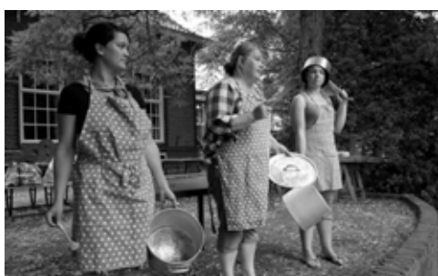
de keukenploeg stelt zich voor