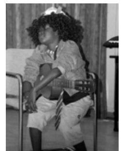
acteren is zo grappig