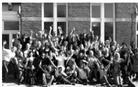
één grote Korczak familie: deelnemers uit 8 landen