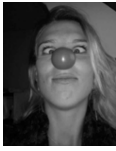
De workshop clowning was zeer serieus

leiders die zulke prachtige ervaringen aan de deelnemers hebben meegegeven. Geniet tot slot van een aantal foto-impressies.