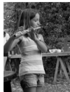
We hadden veel talent in het kamp